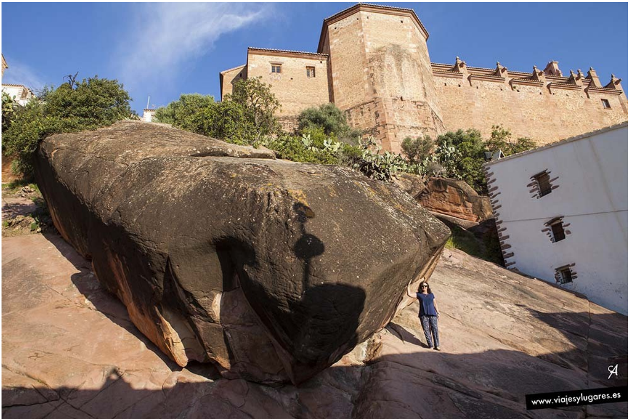
Sujetando la piedrecita

Vilafamés, un pueblo con encanto encaramado en la montaña